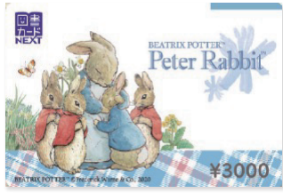
デザインは見本です