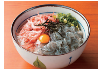
<写真はイメージです>

その他 商品は冷凍のため指定先へ送付となります 申込時に指定送付先の情報が必要となります