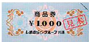
デザインは見本です

しまむら・アベイル・バースデイ・シャンブル・ディバロ全店で 利用できるグループ共通商品券です